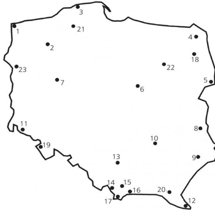
Rozmieszczenie parków narodowych w Polsce