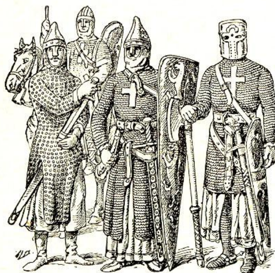
Croisés (XI e -XIII e -siècles).

Przyjrzyj się poniższym ilustracjom, a następnie napisz do jakich wydarzeń z historii średniowiecza nawiązują.